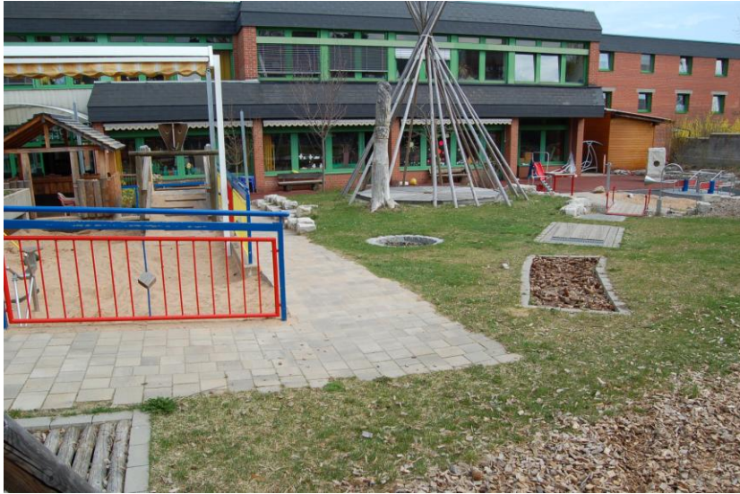
Das ist unsere SVE

Zur Besichtigung, persönlichen Beratung oder Information vereinbaren Sie bitte mit uns einen Termin!